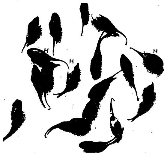
Fig. 1. Symptoms of black colored anthracnose in fruits of Lycium chinense (H : healthy fruits).