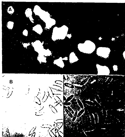
Fig. 2. Acervuli and conidia of Colletotrichum gloeosporioides produced on fruits of Lycium chinense . A) Acervuli on fruit under stereo microscope (40 X). B) Conidia under compound microscope (400 X).

病原菌의 形態와 同定.枸杞子炭疽病罹病果로부터 2種의炭疽病菌이 分離되었다.그 한 種은 70-200 μm 크기의 孢子層을 形成하고 孢子層의 色은 淡黃色 내지 淡紅色을 띄었고 剛毛는 形成되지 않았다. 分生孢子는 圓筒型으로 양끝이 약간 둥근모양을 하고 그 크기는 11.2-18.7×3.7-6.2 μm였다. 이 菌은 PD-A 培地上에서 淡紅色 菌叢을 形成하며 다수의 孢子層을 形成하고 培養期間이 經過하면 孢子層이 連結되어 粘液狀態로 되었다. 이 菌은 Arx (1, 2), 山本(21, 22) Kulshrestha 等(14)이 記述한 Colletotrichum gloeosporioides penz 와 一致하였다. 단지 文獻上에 記述된 C. gloeosporioides 는 培養條件에 따라 짧은 剛毛가 形成되는 것도 있고 形成되지 않는 경우도 있다고 하였는데枸杞子에서 分離된 菌株들은 모두 剛毛를 形成하지 않았다(그림 2).