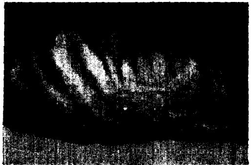
Photo. 1. Multiple erythematous or pigmented nodules on the anterior chest and axilla.(→)

피부 소견 : 흉부, 두부, 액와부에 동통과 압통이 없는 호두크기의 홍반성 결절이 10개 보였다. 촉지시 매우 단단하였으며 어떤 결절은 중앙부위가 흑갈색으로 변색된 것도 있었다(photo. 1).