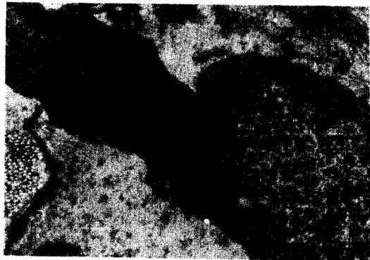
Fig. 6. EM (x5,000) Plump and spindle fibroblast with abundant extracellular collagen formation. (4)

전자현미경적으로는 비대해진 방추형 섬유아세포가 세포 바깥쪽으로 풍부한 collagen을 형성하고 있는 소견