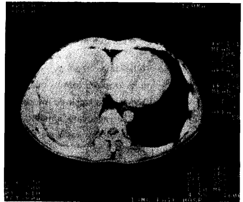
Fig. 2. Computed tomography of the chest shows a mass located in Rt. lower hemithorax with mediastinal shift to Lt. and partial atelectasis of RLL. but no parenchymal infiltration is noted.

병리조직학적 소견 : 종유는 육안상 크기 23×16×8cm, 무게 1500mg의 타원형 종괴이었고 표면은 울퉁불퉁하게 Multilobulate 및 Multiprotrude 되어 있었으며 회백색의 점질에 싸여 있었다. 종유의 단면은 황적갈색으로 다엽성으로 분획되어 있었다. 각기 유주화