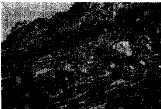
Fig. 4. Pleural lining at Lt. upper corner. The mesothelial lining is well intact. Note scattered tumor cells in vessel rich submesothelial fibrous tissue (x100).

대부분의 환자에서 서서히 발생하는 흉통과 호흡곤란이 첫 증상으로 나타난다. 흉통의 특징은 흉막통과 달리 복부 및 견갑부의 둔통이 특징이다. 특히, 양성에서는 간혹 저혈당증이나 곤봉수지 등으로 나타나는 비대