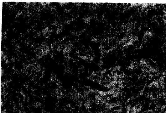
Fig. 5. Collagen forming spindle cell showing pleomorphism and hyperchromatic nuclei with abundant acidophilic cytoplasm but mitotic figures are not noted.