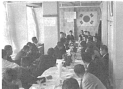
65. 11. 13. 도지부창립총회