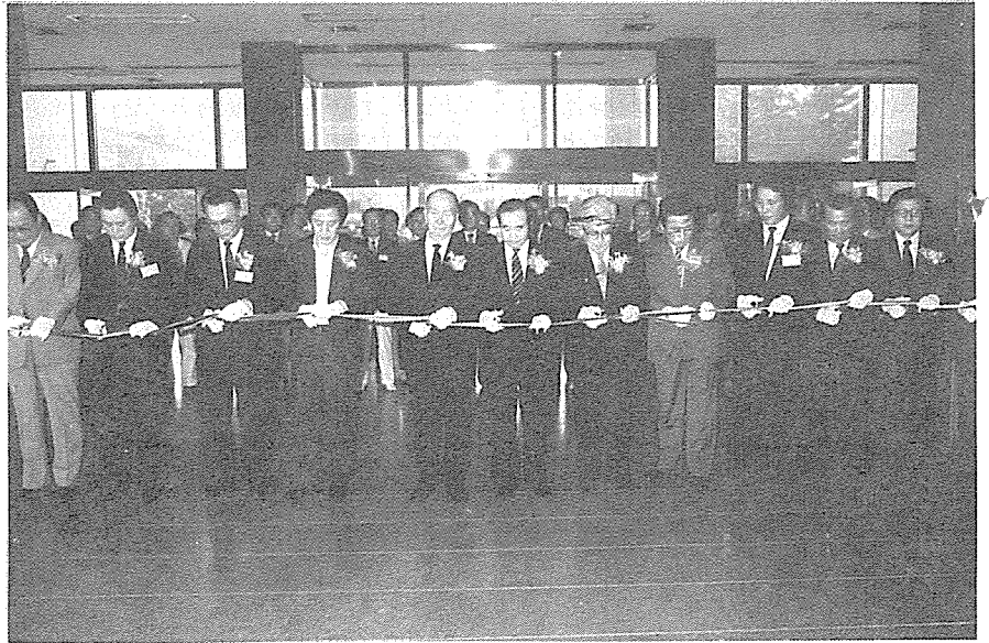
85. 6. 20~25. 85전남건축사회원 작품전