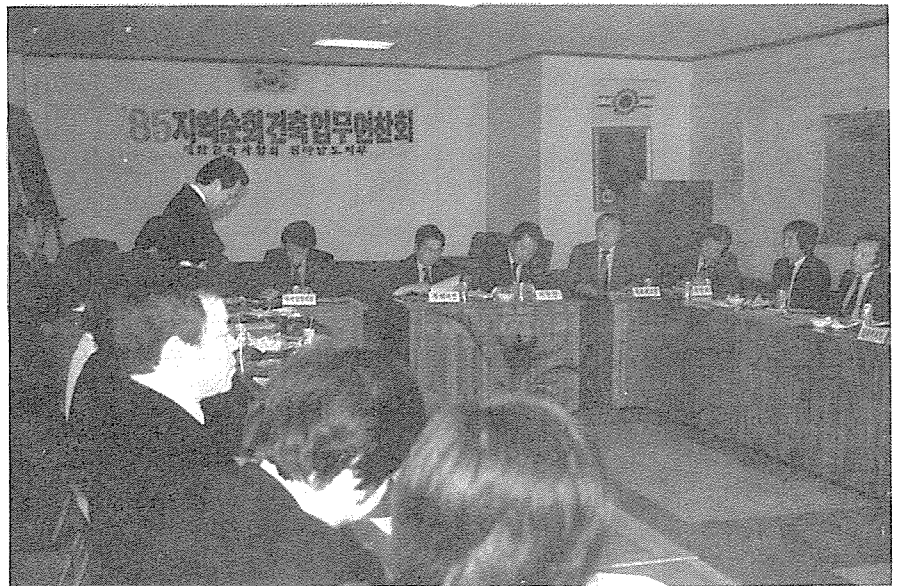
지역순회 건축업무세미나(목포분소 개최)