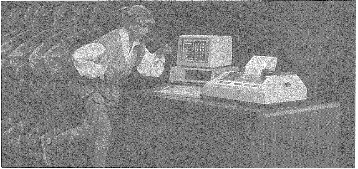
Cost 절감, 표준화를 통한 부품의 공용화가 이루어져야 한다.