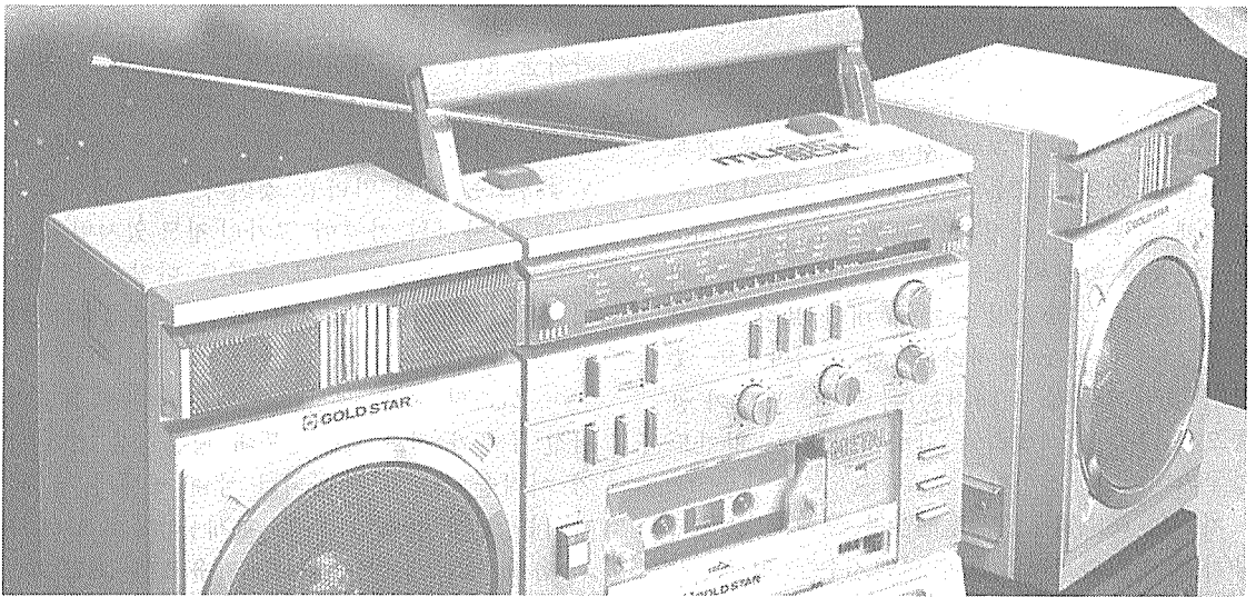
신제품의 탄생에는 반드시 새로운 부품의 개발 및 사용이 필수적이다.

했던 것이다. 게다가 국내의 임금은 점차 상승하고 저임금 국가의 추격은 가속화되는 상황에서 이제 단순 조립 생산만으로는 이미 성장의 한계점에 도달한 감이 있다.