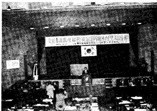
농수축산신보(대표 엄 익채)가 주관하고 한국축산경영학회(회장 류 제창)가 주최한 제 1 회 축산