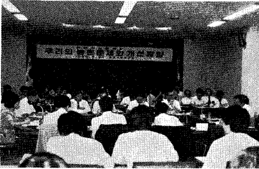
△ 농촌문제 개선방향 토론회

「농촌문제와 개선방향」에 대한 공개토론회가 현대사회연구소(소장 윤양중) 주최로 8월26일 동연구소 대회의실에서 열렸다.