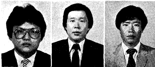
(유 한 기)