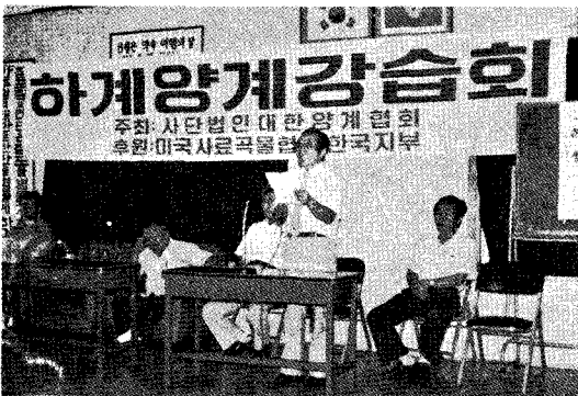
△ 전주세미나 광경

본회 85하계전국순회 양계강습회가 서울, 대전, 전주, 광주, 대구, 부산, 제주에서 각각 성황리에 개최되었다.