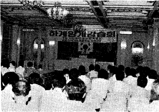
△ 대구세미나 광경

영남지역세미나는 8월 5일(월) 대구 명성에식장(140여명 참석), 6일(화) 부산 온천에식장에서 160여명이 참석한 가운데 진지한 의견을 나누었다.