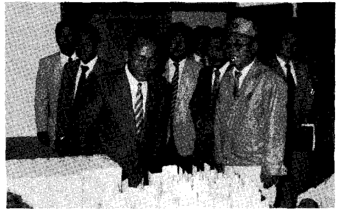
△ 공사시설을 둘러보는 김성진 장관

이들이 만든 사료를 소·돼지 등 가축에게 먹이면 중금속성분이 체내에 남아 소화기장애, 하혈, 피부병 등을 일으키며, 심한 경우 심장마비와 유산의 원인이 되기도 한다.