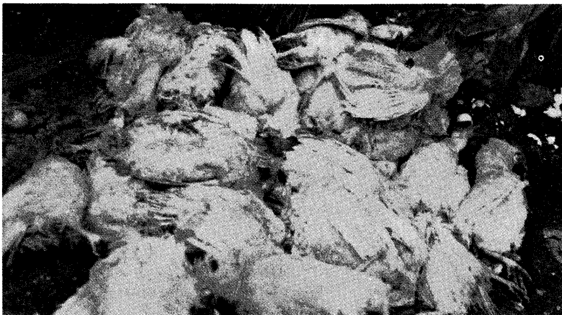
△ND는 일단 발생하면 가공할만한 무서운 피해를 수반하지만 효율적인 백신프로그램에 따른 예방은 안전하게 발생을 방지한다.

려야 하며, 계사 인콰는 철저히 소독하여 최소한 2주이상 비워두어야 한다. 특히 이 병의 발생이 사람의 이동이나 신계의 입사로 인해 전파되는 경우가 드물지 않으므로 이 병의 유행시에는 보다 철저히 외부로부터의 전파를 차단하는데 힘써야 할 것이다.