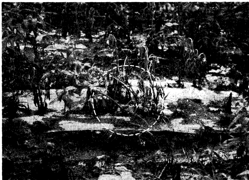
◇ 참깨풋마름병 피해 포장전경

풋마름병균은 세균으로서 물에 의하여 옮겨지기 때문에 토양습도는 이 병의 발생에 가장 큰 역할을 하게 된다. 토양습도가 높을 경우, 풋마름병 발생에 미치는 영향을 보면, ① 토양속에서의 병균 증식이 잘되어 풋마름병균 수가 늘어나게 되고 ② 풋마름병 발생식물의 뿌리를 약하게 만들어서 병균감염이 쉽게 되며 ③ 풋마름병균이 침입된