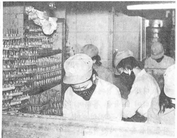
작업장에서 보호구를 착용하고 작업하는 모습