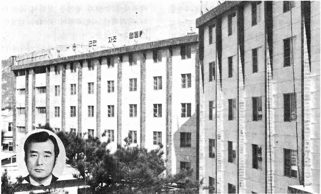
◎ 환경관리가 잘 되어 있는 기숙사전경 ( 좌측 : 여자기숙사, 우측 : 남자기숙사 )

부산시 북구 화명동 1170 번지에 소재한 흥아공업유한회사는 정 효택 대표이사를 중심으로 약 1,500 명의 근로자가 타이어 튜브를 제조하는 사업장으로 1951년 6월에 창설되어 현재에 이르기까지 여러 부문에 걸쳐 각종 수상과 표창을 받은 바 있으며 산업보건 분야에 있어서 노사협조아래 유해부서 작업환경 개선등으로 근로자 건강증진에 기여도가 큰 우수사업장이다.