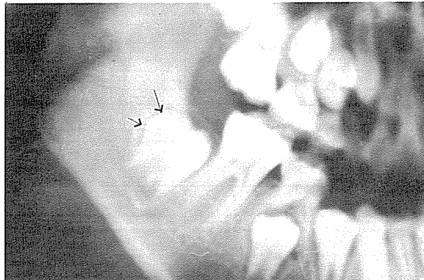
사진 2. 정상적인 치낭