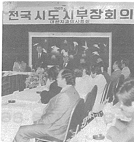
〈총회에 앞서 각 시도 지부장 회의〉