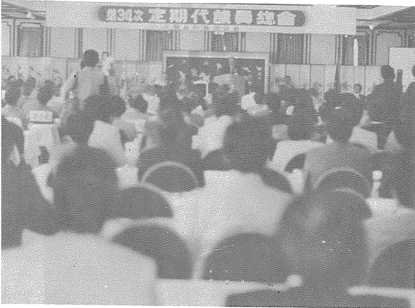
〈대망의 제34차 정기대의원총회 개막식〉