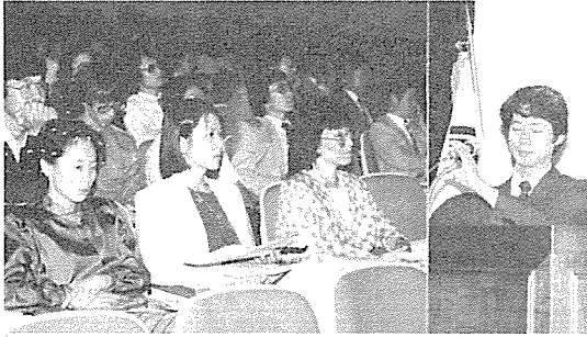
〈학술대회 석상에서 강연에 열중하는 연자와 이를 경청하는 동문〉