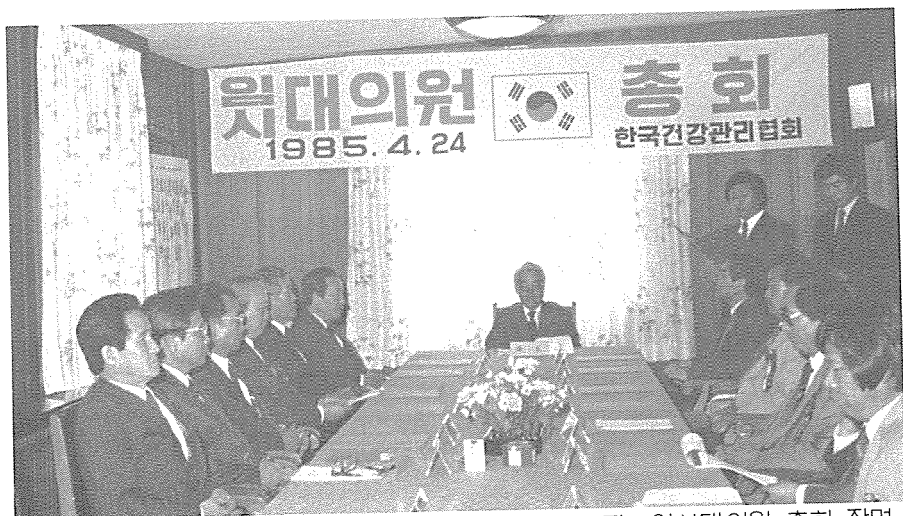
사진 : 임시대의원 총회 장면

한국건강관리협회 임시 대의원총회가 지난 4월 26일 11시 30분 서울 을지로 소재 스칸디나비아클럽에서 개최되어 사업부장의 전회의록낭독과 85년도 일반회계 사업계획 및 예산 승인 결과보고, 85년도 사업추진 현황, '85년도 예산 집행현황보고에 이어 부의안건으로 임원(회장, 부회장, 이사, 감사) 선출이 있었다.