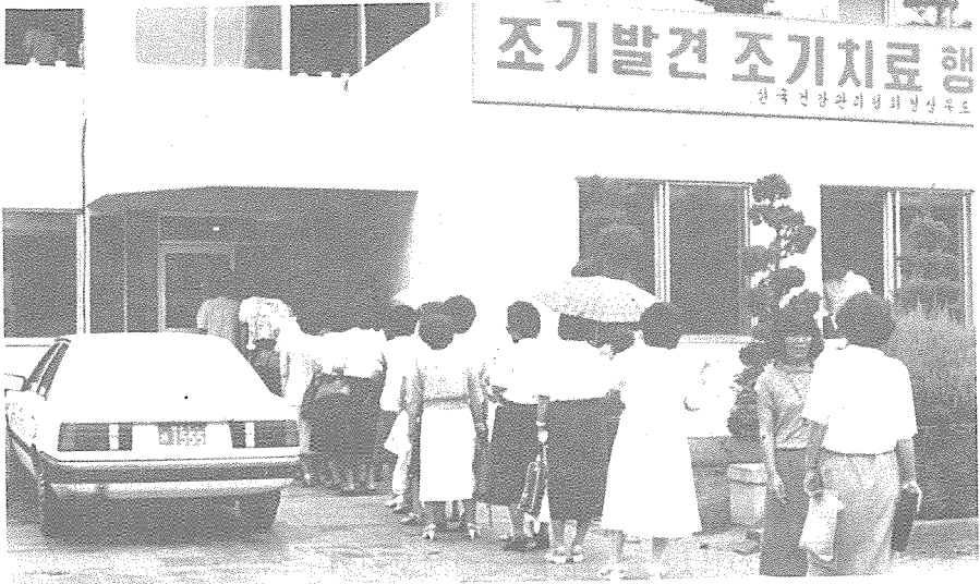
〈사진 : 부녀회원들의 집단검사 실시〉

健協 경상북도지부는 지난 7월 19일부터 12일까지 새마을 중앙본부 경상북도지부 새마을부녀회원 423명의 집단 건강검사를 실시했다.