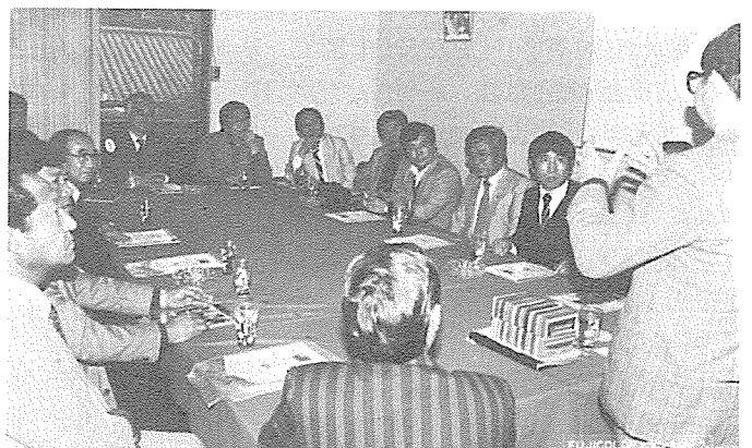
□ 의견교환을 하는 시찰단