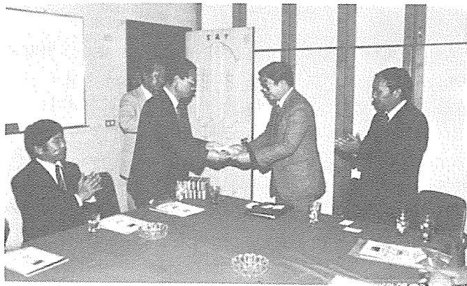
□ 기념품교환(우측이 자유중국 高이사장)

동지부는 지난달 23일 소속회원들로부터 모은 성금 1천2백만원(제주지역회원 1천만원·서귀포지역회원 2백만원)을 제주신문사에 전달해서 소년체전 개최를 적극 지원했다.