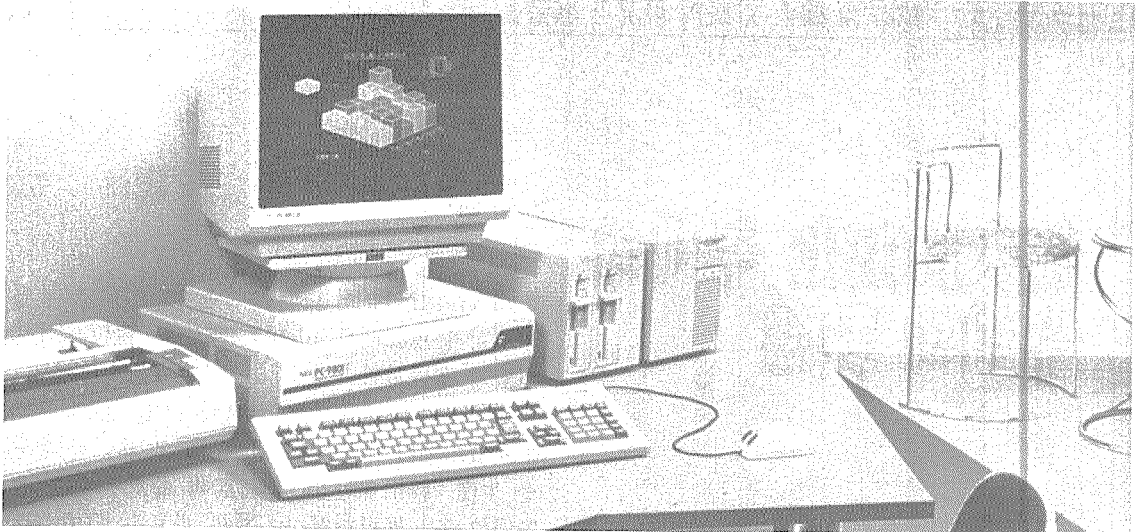
자원의 확보를 위한 시장의 다변화는 그 중요성이 더욱 증대되고 있다.

즉 자유貿易을 표방하면서도 自國利益을 위해 保護貿易의인 조치를 될 수 있는한 채용하고 있는 것이다.