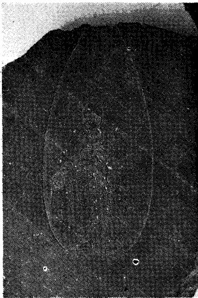
圖 1) 「阿彌陀石板佛」, 가로 60cm, 세로 43cm, 高麗時代. 弘益大學校 博物館소장,

그러면 아직껏 소개된 바 없는 이 아미타석판불상의 양식적 특징과 제작연대 및 관석의 용도등을 규명해 봄으로써 이 石板佛의 자료적 가치와 미술사적 의의를 다소 부각시켜 보고자 한다.