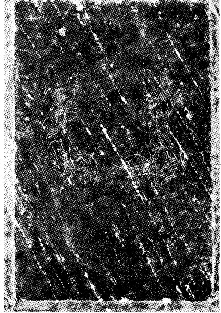
圖 13) 石棺 蓋石, 76cm×102, 高麗時代 梨花女子大學校博物館 소장