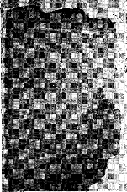
圖 12) 許載 石棺 蓋石, 51.3×89cm, 高麗時代 1144년 (仁宗 22년), 國立中央博物館 소장