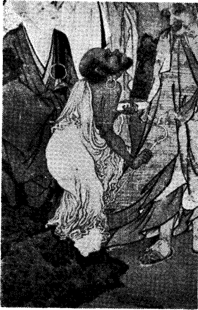
圖 9) 林庭珪筆「五百羅漢圖」부분 南宋, 京鄉 大德寺