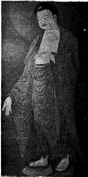
圖 7) 「阿彌陀如來圖」, 135.8×58.4cm.

이 선각아미타석관불입상과 비교되는 대표적인 작품중 마치 버들잎과 같이 밑으로 불룩한 모습의 光背의 경우, 慧虛筆(淺草寺소장) 「觀音菩薩立像」이나 西福寺藏 「阿彌陀佛立像」과 닮았다. 7) (圖 4) 그리고 正法寺소장의 「阿彌陀來迎圖」라든지 救世 勢海美術館의 「阿彌陀三尊佛」의 본존불, 그리고 海