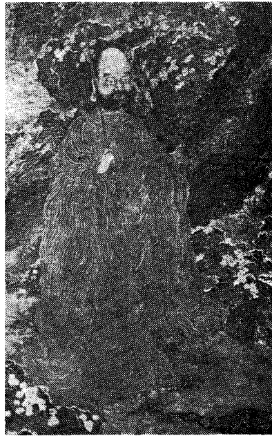
圖 10) 陳用志, 「釋迦牟尼像」, 宋 1025 년경, Boston 미술관 소장

印寺 소장 「線刻木板阿彌陀佛像」과 그 자세나 法衣, 옷주름의 처리에서 공통점이 발견된다. (圖 5, 6) 이 중에서도 1300년 전후에 조성된 것으로 추정되는 正法寺 佛像과는 자세라든지 얼굴, 옷주름은 물론 가슴에 새겨진 卍字, 手印형식 등이 유사하며 왼손의 둘째 손가락을 살짝 구부린 모습에서는 더욱 비슷한 느낌이 든다. 다만 오른팔을 수평으로 내민 모습이나 동적인 느낌을 주는 흔들리는 듯한 옷자락, 예리한 筆線 등의 다양한 표현 방법에서 이 홍익대 박물관의 석판불이 좀