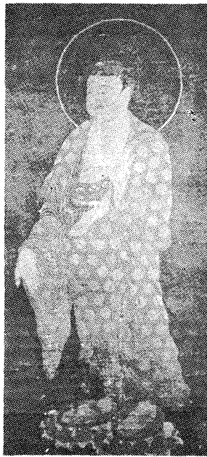
圖 5) 「阿彌陀如來圖」 184.5×86.5cm, 高麗後期 日本 正法寺 소장