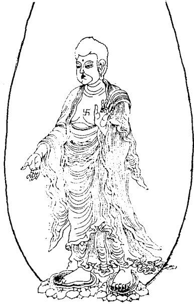
圖 3) 「阿彌陀石板佛」(圖面)

에 바탕을 둔 부처이다. 1) 이 염불을 통한 정토신앙은 7세기 후반의 통일신라시대부터 크게 유행하였으며, 2) 고려시대에 이르러 더욱 널리 퍼져 대중화되었던 것이다. 그러한 구체적인 예로서는 고려 仁宗時(1123~1146年) 律億大師에 의해 智異山 五臺寺에서 염불을 목적으로 한 水晶結社의 결성이라든지, 3) 고려후기의 曹溪宗과 天台宗에서 주창한 염불실천의 불교관은 그 대표적인 예라 하겠다. 4)