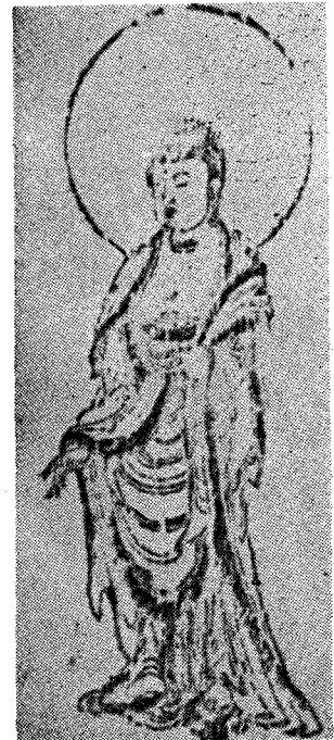
圖 6) 「木板阿彌陀佛」, 크기미상 高麗時代, 海印寺 소장