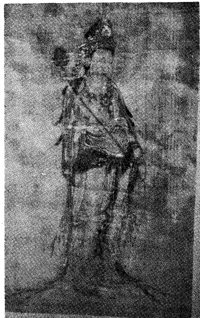
圖 8) 普悅筆 阿彌陀三尊圖중 「勢至菩薩像」 南宋, 京都 清淨單院