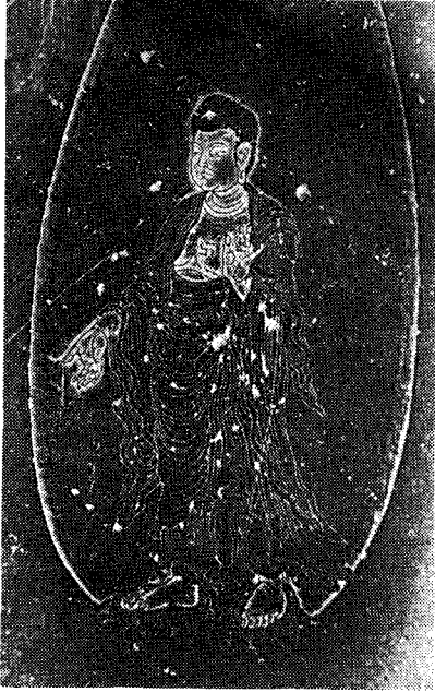
圖 2) 「阿彌陀石版佛」