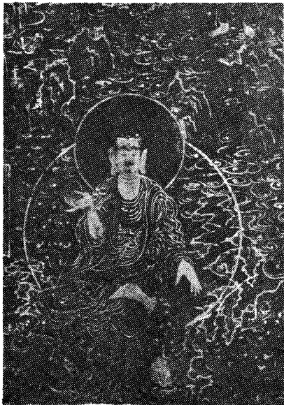
圖 11) 魯英, 「地藏菩薩圖」高麗 時代 1307年, 黑漆金泥, 國立中央博物館 소장

印寺 소장 「線刻木板阿彌陀佛像」과 그 자세나 法衣, 옷주름의 처리에서 공통점이 발견된다. (圖 5, 6) 이 중에서도 1300년 전후에 조성된 것으로 추정되는 正法寺 佛像과는 자세라든지 얼굴, 옷주름은 물론 가슴에 새겨진 卍字, 手印형식 등이 유사하며 왼손의 둘째 손가락을 살짝 구부린 모습에서는 더욱 비슷한 느낌이 든다. 다만 오른팔을 수평으로 내민 모습이나 동적인 느낌을 주는 흔들리는 듯한 옷자락, 예리한 筆線 등의 다양한 표현 방법에서 이 홍익대 박물관의 석판불이 좀