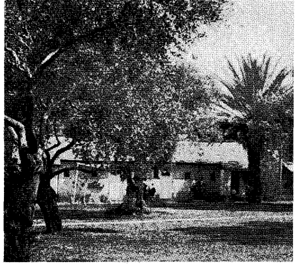
△ 각 키부츠는 공동식당, 세탁소, 병원을 가지고 있다

서는 협동과 일의 중요함을 강조하고 서로 타협하는 것을 배우는데 도움을 준다. 직장에 있는 동안은 어린이를 봐주는 것으로부터 해방된 부모는 일이 끝나후나 주말과 휴일에 그들의 어린이와 같이 있게 된다. 유아원, 유치원, 국민학교가 곳곳에 준비되어 있으며 큰 아이들은 학문과 사회접촉 양면의 폭넓고 다양성 있는 지역 키부츠 고등학교에 다닌다.