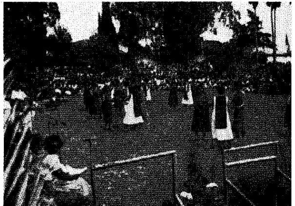
△ 키부츠는 독특하게 축제·기념행사를 벌인다