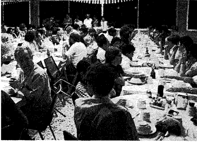
△ 모든 회원은 같은 생활수준을 향유한다