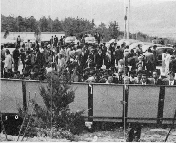
검정사업계획에 설명을 청취하는 내빈