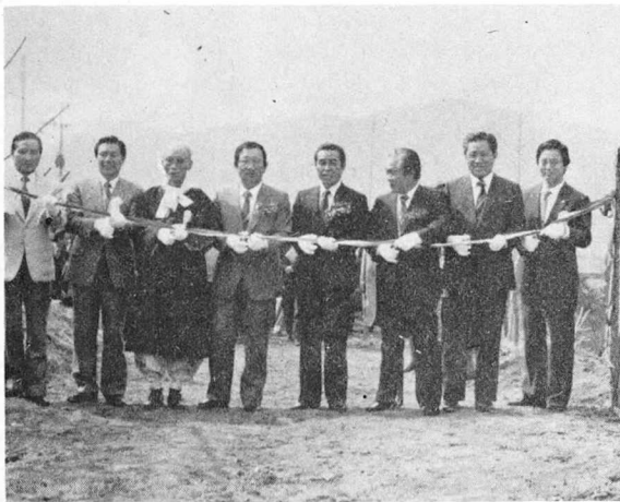
중돈 능력검정시대 개막을 고하는 준공테이프 절단 모습.