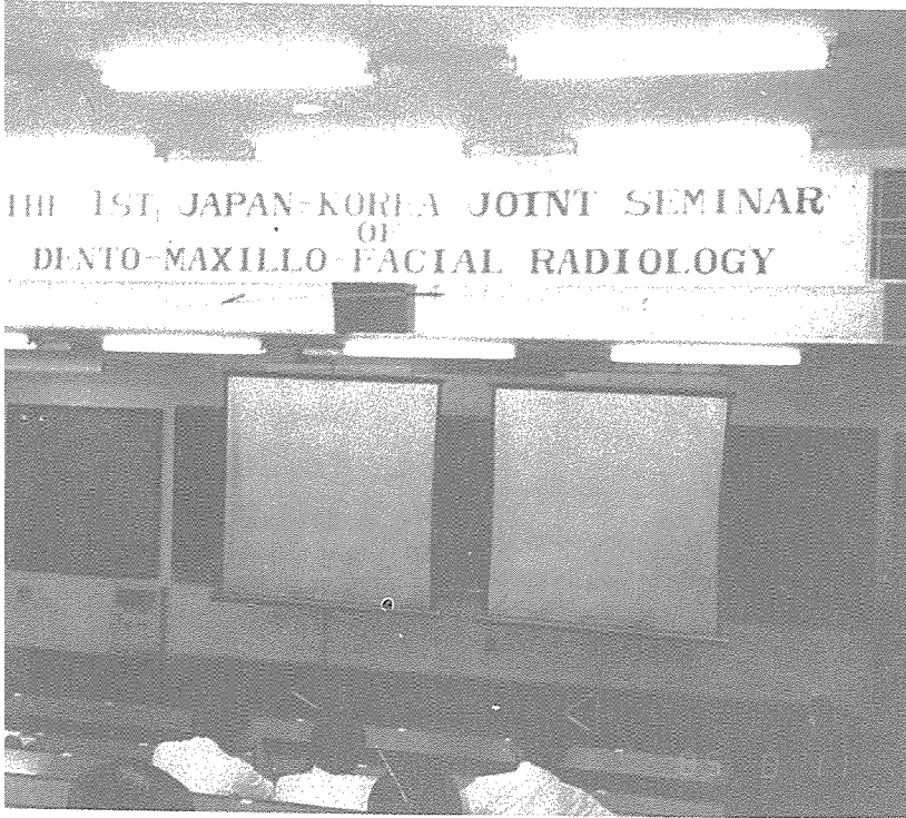
〈合同세미나場인 岐阜大 會議室〉