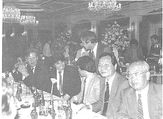
〈신라호텔에서 회식을 겸한 간담회에서는 각국 치의학자의 근황과 상호교류에 대한 토론이 진지하게 전개되었다〉