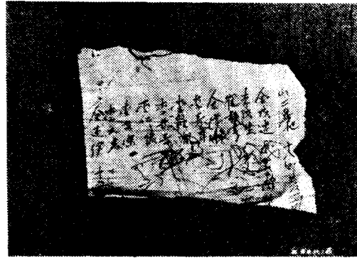
Fig. 2. Original list of owners of plot No. 2

查對象으로 하였다. 調查方法是 山主 및 住民의 面談과 그 當時에 所有者가 保管하고 있는 資料 等を 土臺로 實施하였다.