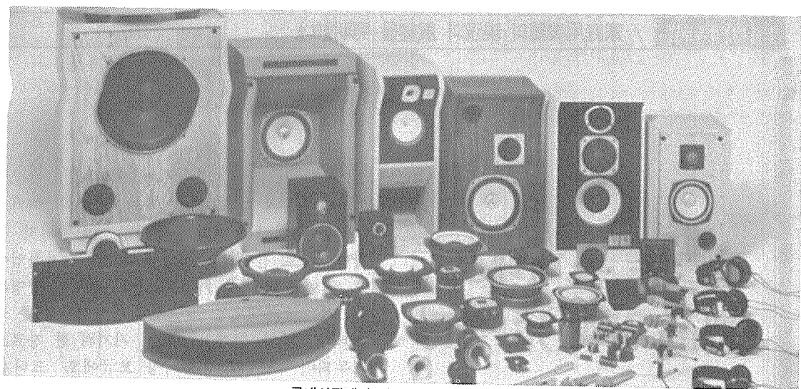
국내시장에서 기반을 확고히 한 다음 치열한 국제경쟁에서 우위를 선점해야 한다.

수단의 발달과 함께 더욱 더 확대되어가며 기본적인 사회생활에서의 해방을 위해 수반되어야 하는 여가 활용에 별도의 휴대용이한 소형 오디오 기기가 등장하게 됨은 지극히 타당성 있는 추세라고 볼 수 있다.