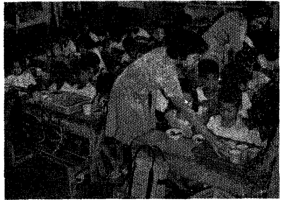
△ 학교에서도 영양식 섭취 캠페인이 벌어지고 있다.

중공의 연간 축산물생산량을 보면 표 1과 같이 1952년도의 인구가 574.8백만에서 1979년도에 970.9백만으로 69%가 증가한데 반하여, 축산물생산량은 같은 기간에 3,390천톤에서 10,630천톤으로 214%가 증가한 것으로 보아 중공에서도 축산이 인구증가율을 앞지르고 있음을 알 수 있다. 같은 기간중의 곡물생산량은 1952년에 163,900천톤에서 1979년에 332,100천톤으로 103%가 증가되었는데 곡물생산량의 증가율이 인구증가율보다는 높았으나 축산물생산량 증가율보다 낮았으며, 해산물의 생산량은 1952년에 1,670천톤에서 1979년에는 4,310천톤으로 158%가 증가한 것으로 보아서 중공의 식생활양식이 곡물위주에서 동물성단백질인 축산물과 해산물 쪽으로 변화되고 있다는 것을 보여주고 있다.