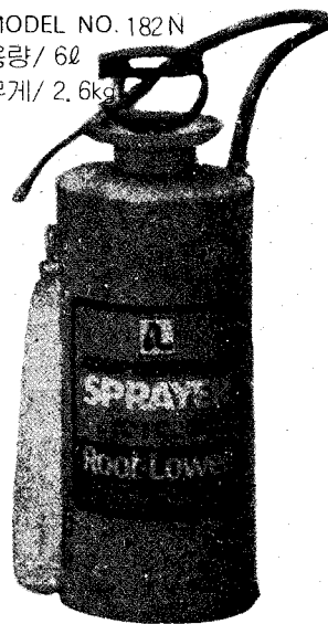
MODEL NO. 182N 용량/6ℓ 무게/2.6kg

● 폴리분무기에는 임의로 분무를 조절할 수 있는 낫쇠노즐이 부착되어 있습니다.