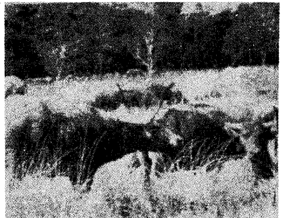
△ 들소들이 방목되고 있는 광경

중공에서 배합사료를 급여하여 사육하는 가축은 닭과 돼지인데 육용계는 75일에서 2kg에