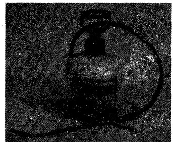
MODEL NO. 1991 용량/4ℓ 무게/1.8kg