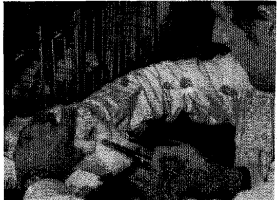
△ 외래성 질병의 침입은 양계산업 발전을 저해하고 있다. 계군위생검사는 혈청을 채취 해 조기 질병 방역에 중요한 역할을 할 것이다.

른 시일 내에 그 질병을 발견하여 대책을 세우 느냐에 따라서 양계산업에 미치는 영향도 그만큼 클 줄로 안다. 따라서 우리는 계군별 혈청검 사사업을 통해서 새로운 질병을 조기에 발견하 여 빠른 시일내에 예방대책을 강구할 수 있는 중 은 점을 가지고 있을 뿐만 아니라 큰 안목으로 전국적인 닭질병에 대한 예찰을 가능하게 하여 신속한 방역대책을 세울 수 있는 장점을 가지고 있다.