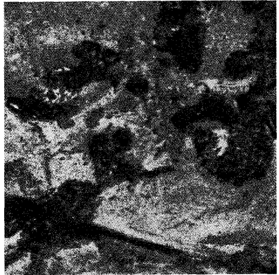
△ 병변이 콕시듐과 비슷하다

○ 항원은 SPF 닭에 접종하여 감염된 간이나 감염된 장노막을 유제하여 제조하거나 신장세포배양으로 배양액을 원심, 상청액을 암모니아 처리 및 투석처리해서 1/10로 농축하여 항원으