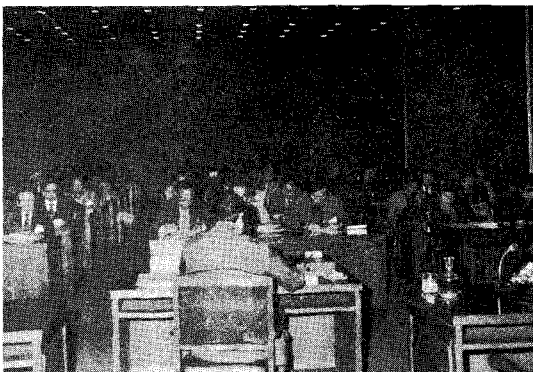
△ 1982년도 정기총회

본회 1982년도 정기총회가 지난 12월 20일 오후 2시에 한국무역협회 무역회관 7층 회의실에서 전국의 대의원과 각계인사가 참석한 가운데 성대하게 개최되었다.