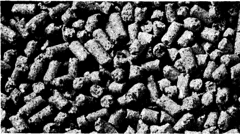
◁ 배합사료에 대한 자율적인 성분등록으로 우리나라 사료사의 새로운 장이 열렸다. 업계는 가까운 시일 내에 후속조치가 계속 있을 것을 기대한다.

면에서 아쉬움을 그대로 안고 또 다음 기회를 기다리는 수밖에 없게 되었다.