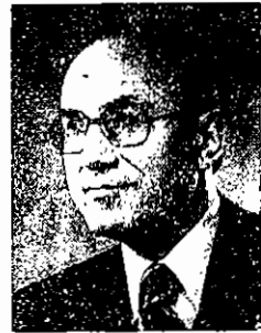
Michael I. Sovern (콜럼비아大學 總長)