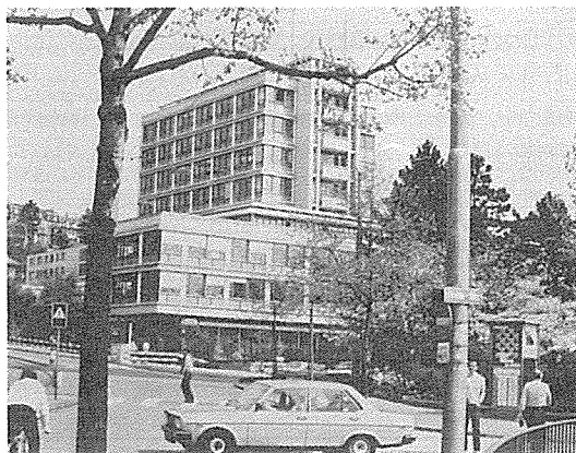
사진 1. 쥘리히 치대 및 병원

본인은 지난 83년 2월부터 5월 초순까지 스위스 쥘리히 치대 악안면외과 교실을 방문하여 이곳 교수들과 접하고 의견을 나누었으며, 강연도 듣고, 하여 주기도 하였다. 또한 이곳 병원에서 외과적안모 교정술등 여러가지 새로운 施術方法등을 見學하면서 새로운 手術方法을 研究한 바 있다. 誌面과 시간이 허락되는 범위안에서 앞으로 數回에 나누어서 악안면외과 교정술에 대하여 구체적으로 소개하고자 한다. <필자 주>