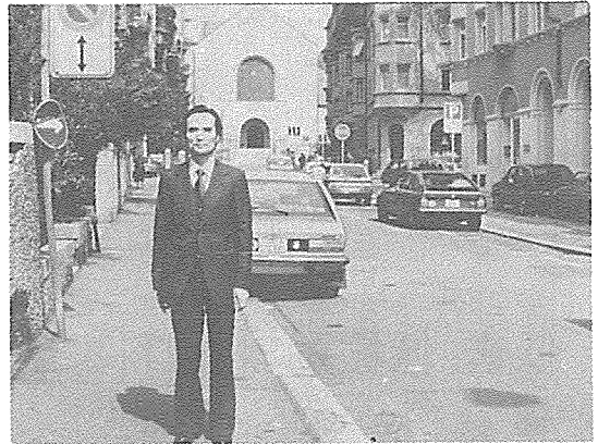
사진 4. 유리히 시내 Me'nerva Street 가에 있는 기숙사앞에 선 필자

<다음호에는 Le Fort I 골절단술에 의한 안모교정술에 대하여 기술코져 한다>