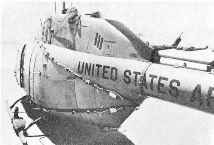
헬機用 REACT 장치

符號化된 메세지는 눈에 보이지않는 光線信號를 增幅하여 전달하는 레이저에 연결된다. 符號