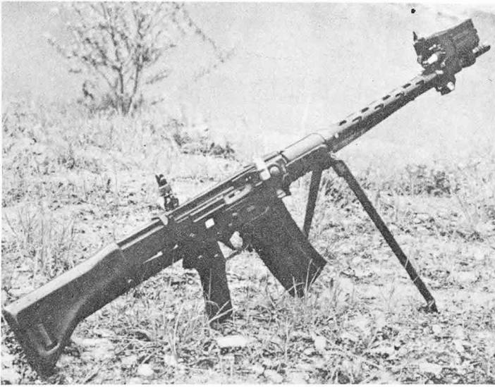
小銃에 부착되어있는 레이저送信器

加해지면 電子는 蹶起狀態가 되고 에너지를 吸收 혹은 放出하면서 에너지값이 변하게 된다.