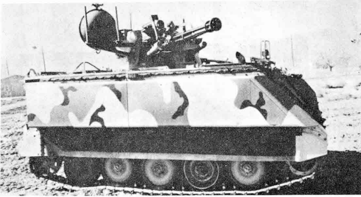
발칸對空砲에 설치된 REACT 장치

에는 발사된 武器의 致命度에 관한 基本的인 정보가 포함됨으로써 野戰에 사용되는 다양한 종류의 武器들을 구분하는 方法을 제공한다.