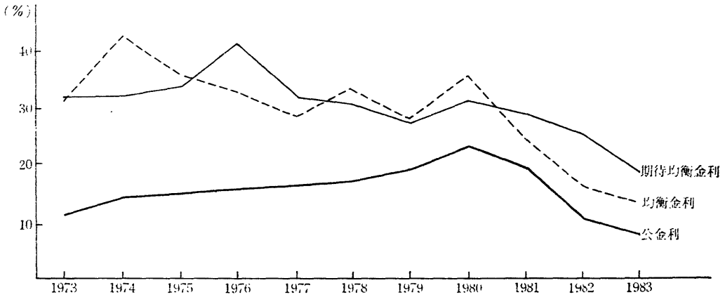
[圖 1] 均衡金利水準

量的 資本 및 勞動에 대한 分配率 13) 이 되는 바 韓國銀行 13) 이 J.R. Artus 14) 의 方法에 의하여 算出한 結果를 보면 \hat{\alpha}=0.36 , \hat{\beta}=0.64 이다.