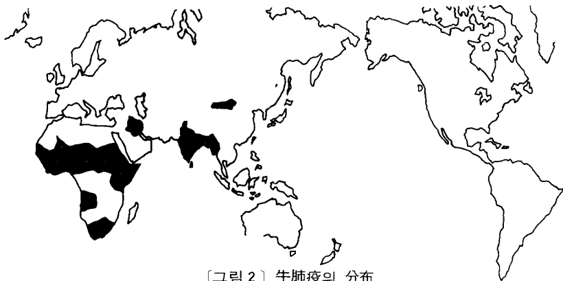
[그림 2] 牛肺疫의 分布