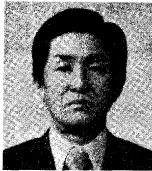
이 병 호