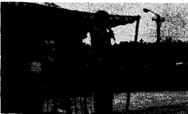
◀ 박인수 지부장 인사말을 하는

본부(부화, 동물약품, 사료업계 포함), 채란분과, 육계분과, 계란판매업자, 육계판매업자 등 300여명이 참석해 성황을 이룬 이날 체육대회는 축구, 줄다리기, 200m 계주, 2인 삼각경기등 4종목을 겨루었다.