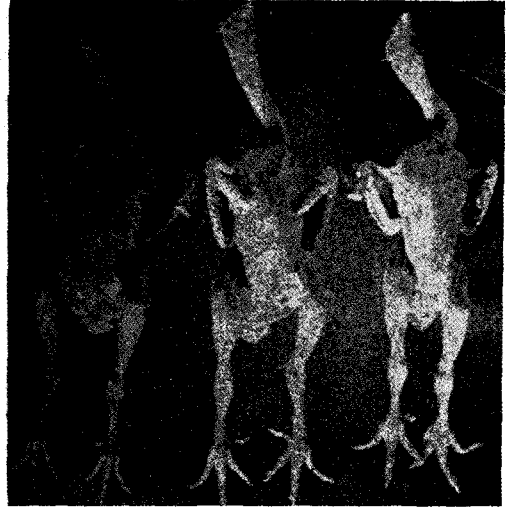
A 급 B 급 C 급

한다. (이는 우리가 소위 말하는 “도계된 닭”과 의미가 같다. 日本에서 “屠體”라 함은 닭털과 혈액을 방혈만 시킨 상태 과정을 말한다)