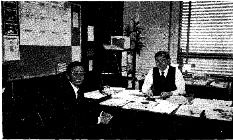
◁ 미국사료협회 보이드 부회장(右)과 필자(左)