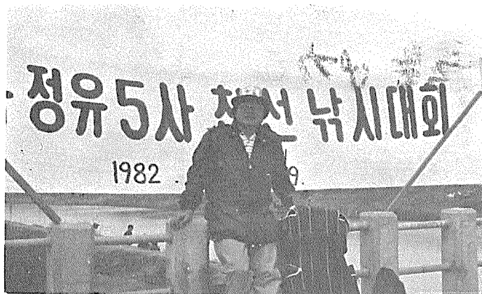
◇ 제 2회 精油5社 친선낙시大會