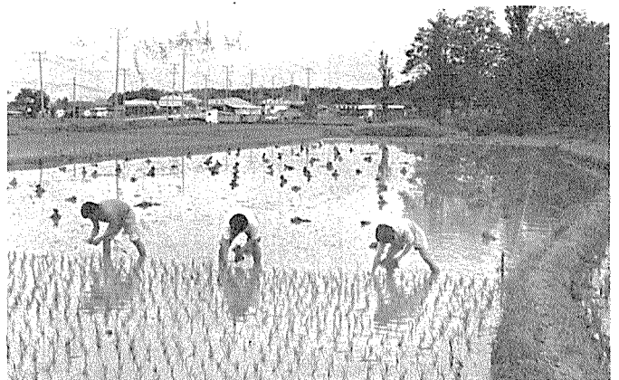
◇ 모내기支援하는 石油協직원

三一社의 새 전화번호는 (交) 677-6661~5, (直)代表이사실 677-2200, 판매부 677-2001, 운영과 634-1741.