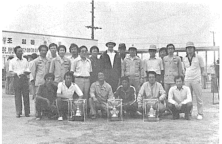
◇ 京仁에너지 仁川工場 새마을团舍大会 시상后

또한 仁川정유공장은 지난 5월 29일 하오 공장새마을단합대회를 열고 야구, 배구와 줄다리기 등으로 즐거운 하루를 가졌다. 이 대회는 공장새마을운동의 활성화방안의 하나로 해마다 2회씩 개최된다.