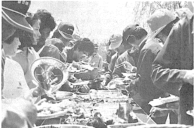
◇ 京仁에너지 春季체육大会后的 즐거운 불고기 파티