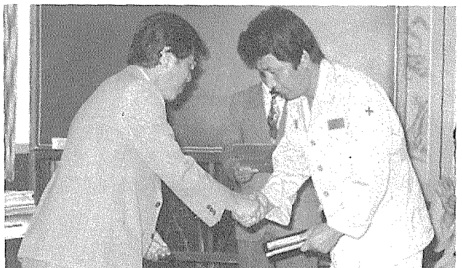
◇ 京仁産業安全관리有功者 시상식