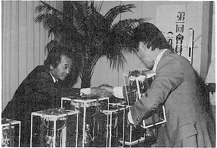
第1回 會員社 친선바둑대회 시상식