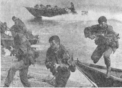
英國軍이 上陸訓練을 하는 모습