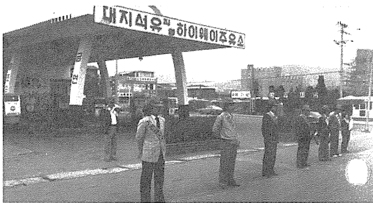
사진 4...寄協 본부 앞의 하이웨이 주유소 부근에서 가두질서 캠페인을 벌이고 있는 기협 직원들. (32. 4. 20)