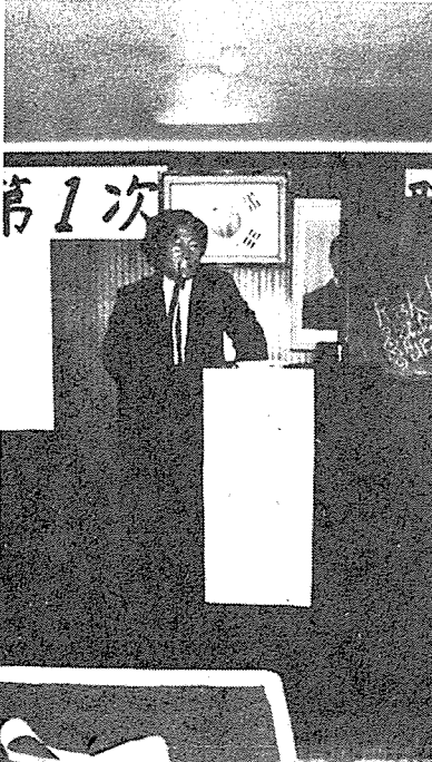
〈사진 2〉 〈사진 3〉