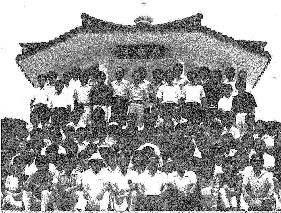
⑥...연수교육 종료후 전체 수강생 및 강사들의 기념촬영