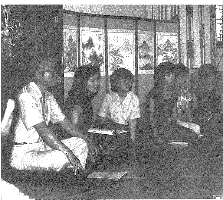
⑤...일일 일과가 끝 난 후 각조 별로 열 띤 분임토의가 한 창이다.