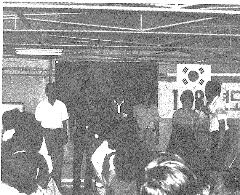
④...각시도지 부 인솔자가 자기 지부직 원들을 소개 하고 있다.