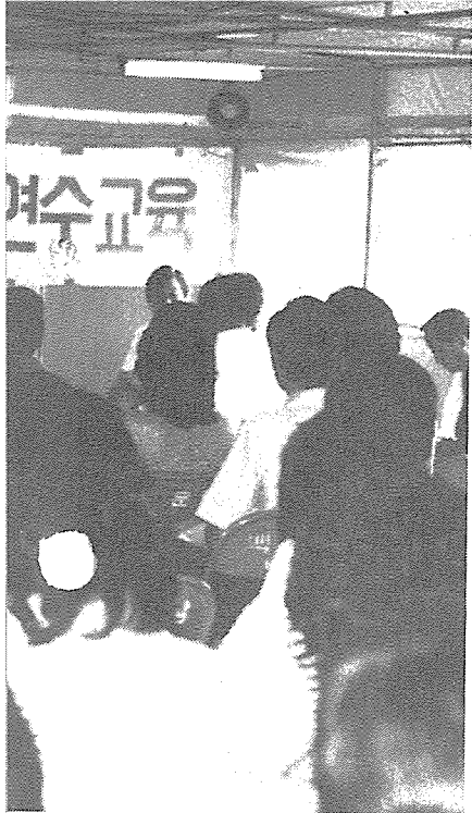
①...전체 직원 연수교육에서 강사의 강의에 열심히 귀기울여 청강하고 있다.