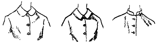
1. Peter pan collar (피터팬 칼라) 2. Soutien collar (스테인 칼라) 3. Chinese collar (차이니스 칼라)

質問紙 形態는 (1) 디자인의 選好度를 調査하는 問項 11個와 (2) 衣服着用에 對한 選好度 調査 7個問項, 總 18個問項의 質問紙를 作成하였다. 統計處理는 選多型으로 頻度를 百分率로 算出하였다.