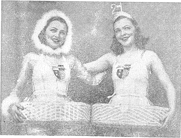
1939年 General 타이어 會社(Ohio州 Akron)에서 發表한 “2 in 1” 타이어의 “Rubber Ball”

이 타이어는 牽引力이 좋은 겨울용 트레드로 되어 있으나 여름에도 使用할 수 있도록 트레드 模樣을 Smooth하게 할 수도 있는, 2季節用 타이어이다. 즉 여름에 使用하기 위해서는 트레드를 갈아내는 作業(Buffing)을 하여야 된다.